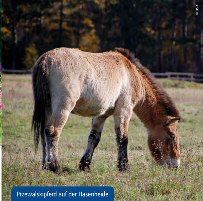
Przewalskipferd auf der Hasenheide

Kosten: Kinder 5 €, Erwachsene 8 €, Familie 16 €