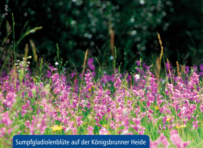
Sumpfgladiolenblüte auf der Königsbrunner Heide