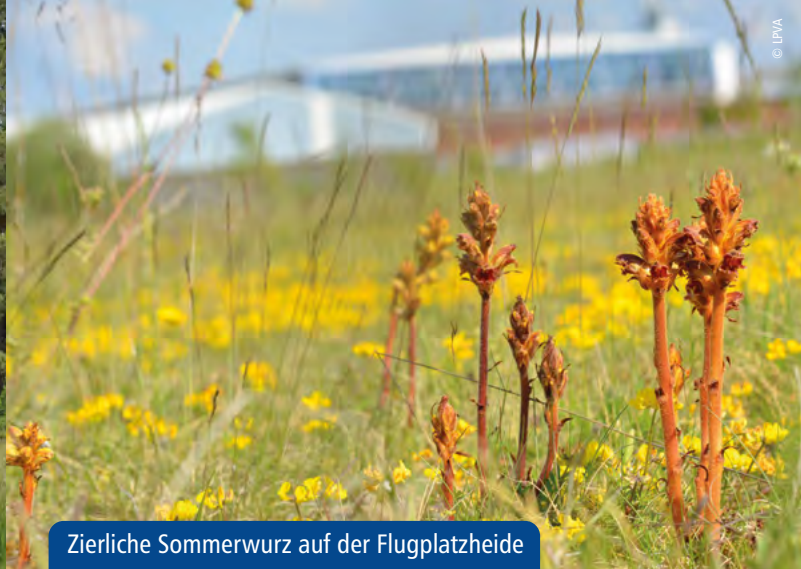
Zierliche Sommerwurz auf der Flugplatzheide