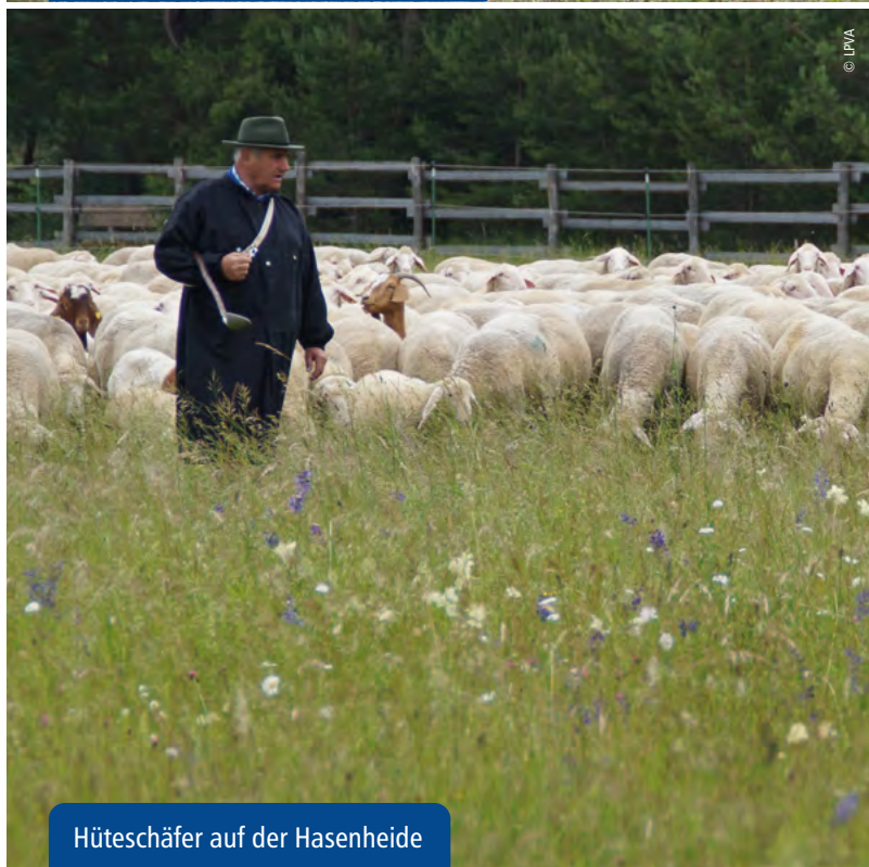
Hüteschäfer auf der Hasenheide