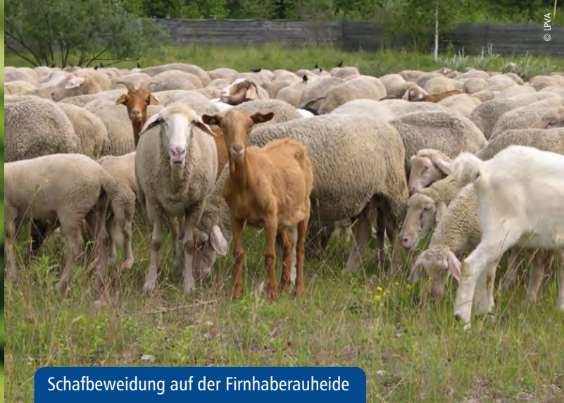
Schafbeweidung auf der Firnhaberauheide